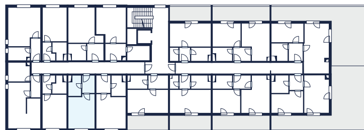
2. nadzemní podlaží | Schéma umístění bytu 217

+420 777 114 302 prodej@uarborky.cz www.uarborky.cz